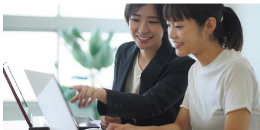
オフィスタの1日缶詰PC研修は習得するまで帰れません

私の職場の前任者はエクセルの使い方をよく知っていて、煩雑な集計作業を簡単に計算できるように作成してくれていました。私が入職し引き継ぎが終わるとその方は退社されました。今もその方のエクセルの関数を用いた集計表は使用していますが、いつ形式が壊れやしないかとヒヤヒヤしています。社内には前任者と同レベルでエクセルが使える方はいません。ならば私が覚えるしかない！と思うようになりました。これからの自分のためにもなると考えて重い腰を上げます。