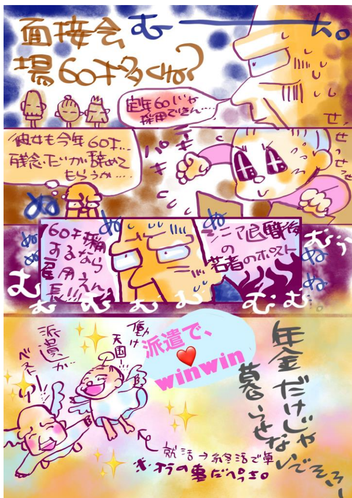
画：あよ。(しらす☆まい)

A. ハケン雇用ではなく正社員雇用の募集であるならば問題ないと思います。契約社員や短期アルバイト、ハケンの募集であるならば、労働施策総合推進法第9条に違反する恐れがあります。年齢で採否をしてはならない