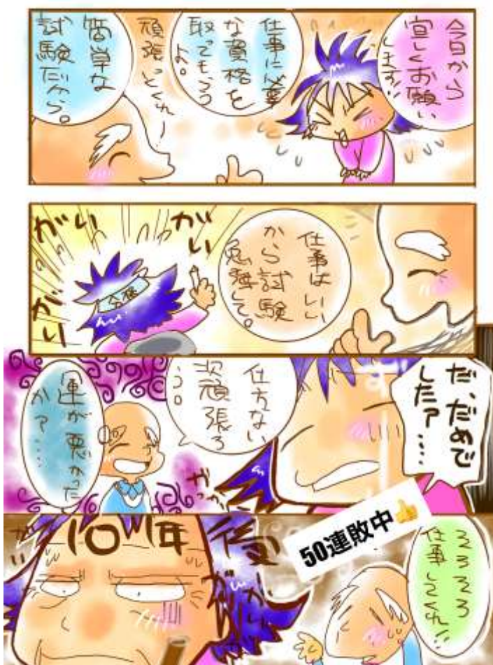
画：あよ。(しらす☆まい)

資格自体は過去問を暗記すれば合格率も高くさほど難しい試験ではないのですが、業務中に試験勉強をするわけにもいかず、帰宅後に時間を見つけて試験勉強をしています。この自宅での試験勉強の時間は残業とみなしても良いのでしょうか（＝賃金発生はするのか否か）。