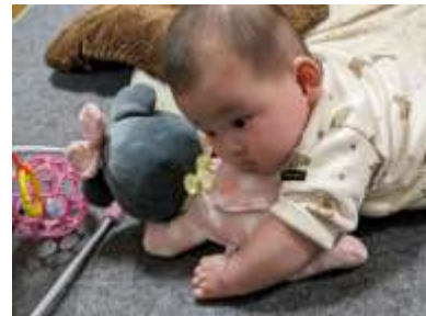
「ミニーちゃんのぬいぐるみと同じポーズをする図」です。

誕生から 5 ヶ月になりました。4 月のはじめ頃は懸命に、という感じで寝返りをしていたのですが、4 月下旬には軽々と寝返りができるようになり、徐々に足の動きもパワフルに。GW 頃には、顔を正面に上げた状態で、部屋の中を見回したり、おとなの顔を見たり、テレビがついているとテレビに注目したりということもできるようになってきました。最近は寝ているから…と目を離すと、寝かせておいた場所とちょっと違う位置にいることも増えました。二児の母になった友人にその話をしたところ、「歩き出したら、もう大変よ…」とのこと。聞くと、友人宅では目を離した隙に上の子がヘアオイルまるまる一本を出してしまい、気づいたときには子供二人ともテカテカになっていたとか…わが子の成長が楽しみなような、恐ろしいような今日このごろです。